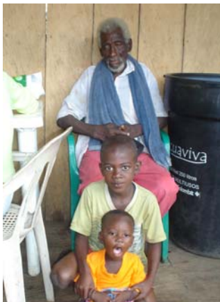
3 generaciones en el pueblo Cacarica en Colombia

Movimiento continental de cristianos por la paz con justicia