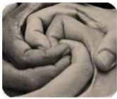
Colectivo Ustedes Somos Nosotros